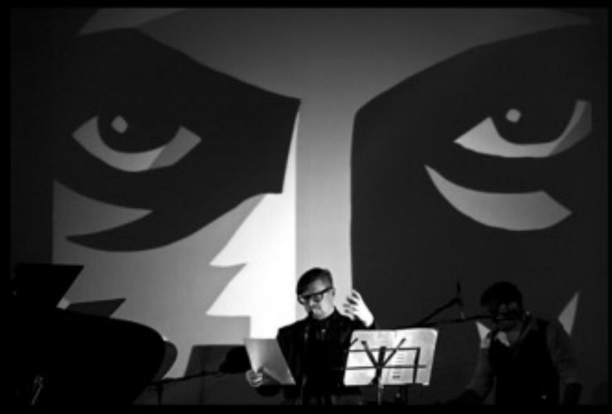
Die Fotos zum Pragomania Festival: liegen im Ordner