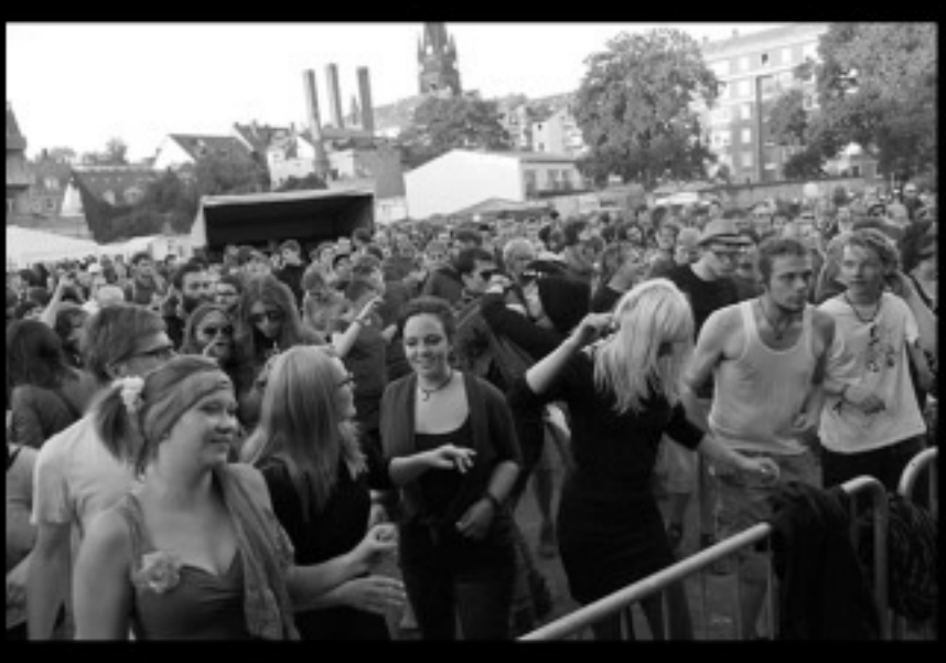
Die Fotos zum Lustgarten: http://kulturaktiv.org/wordpress/?p=7146&lang=en